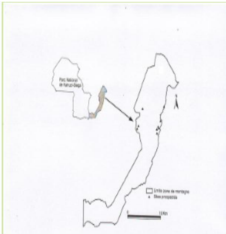
Figure 1 : Carte de la partie haute altitude couvrant 10 % du PNKB

La zone de haute altitude ou zone de montagne du PNKB ( Figure 1 ) se localise entre 1800 - 3308 m d'altitude [12]. Dans cette zone règne un climat tropical humide avec une saison pluvieuse entre Janvier - Mai et Septembre - Décembre, des moyennes des pluies se situant autour de 1700 mm [13]. Le parc doit son nom des monts Kahuzi (3 308 m d'altitude) et Bièga (2 790 m d'altitude) [13, 14].