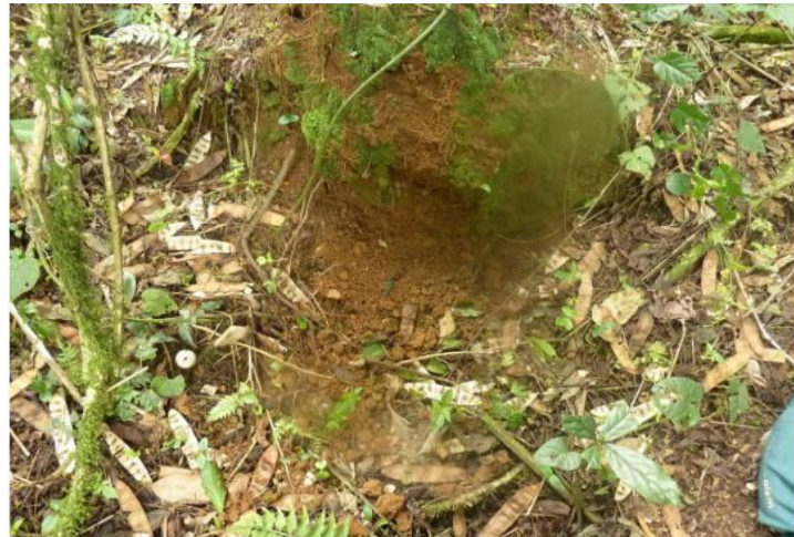
Figure 1 : Une terre creusée par le gorille sur la colline de Mahira dans le PNKB

Ces résultats sont obtenus à partir de la moyenne de nombre d'échantillons de tous les cinq ans et celle de la fréquence. Selon les résultats de ce Tableau l'espèce Gorilla beringei graueri du Parc National de Kahuzi-Bièga secteur de Tshibati ingèrent trois fois par an la terre d'après la moyenne effectuée sur le nombre d'échantillons obtenus et de fréquences après cinq ans. La Figure ci-dessous montre une terre creusée par les gorilles sur leurs traces à une profondeur de 15 cm sur la colline de Mahira dans le Parc National de Kahuzi-Bièga. Ce sol a été retrouvé dans la matière fécale de ces grands singes le jour suivant de récolte.