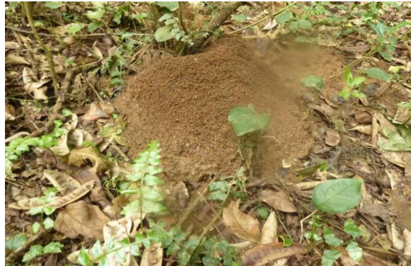
Figure 2 : Terre consommée par le chimpanzé sur la colline Kakerekenje dans le Parc National de Kahuzi-Bièga et retrouvé dans leur matière fécale

moyenne effectuée sur le nombre d'échantillons obtenus et de fréquences après cinq ans. La Figure ci-dessous montre le sol contenant les termitières consommées par les chimpanzés sur leurs traces de la colline de Kakerekenje dans le Parc National de Kahuzi-Bièga.